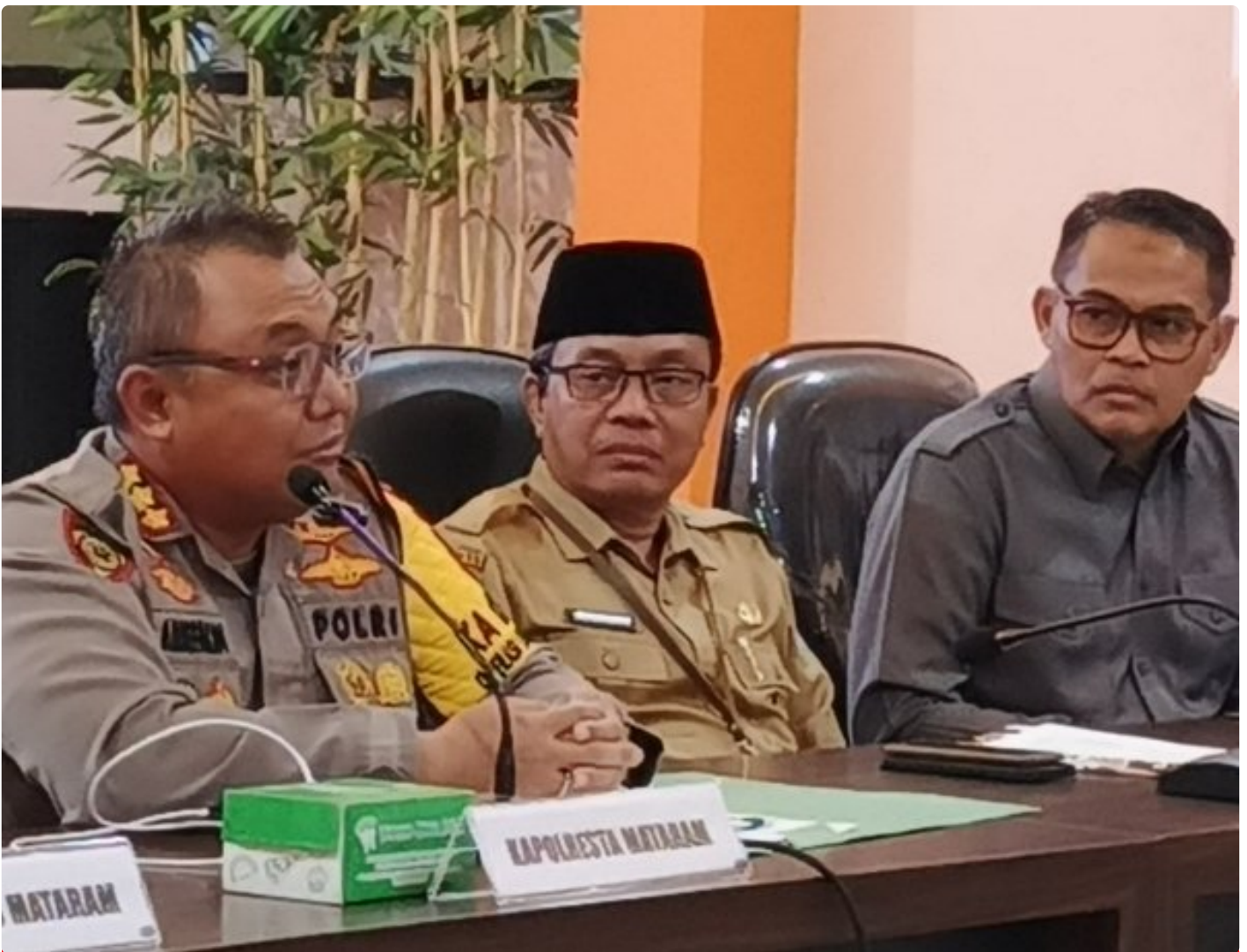
Kapolresta Mataram (Kiri) saat memimpin Konferensi pers akhir tahun, Selagi (31/12/2024)

MATARAM, NTB – Polresta Mataram mengakhiri tahun 2024 dengan menggelar